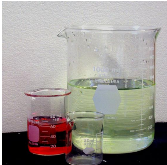
(เว้น 1 บรรทัด)

รูปภาพอยู่กลางหน้ากระดาษ ภาพที่ (TH SarabunPSK ขนาด 16 ตัวหนา) คำอธิบาย (TH SarabunPSK ขนาด 16 ตัวปกติ) และแหล่งที่มา(TH SarabunPSK ขนาด 16 ตัวหนา) ข้อความ (TH SarabunPSK ขนาด 16 ตัวปกติ) อยู่ใต้รูปภาพ